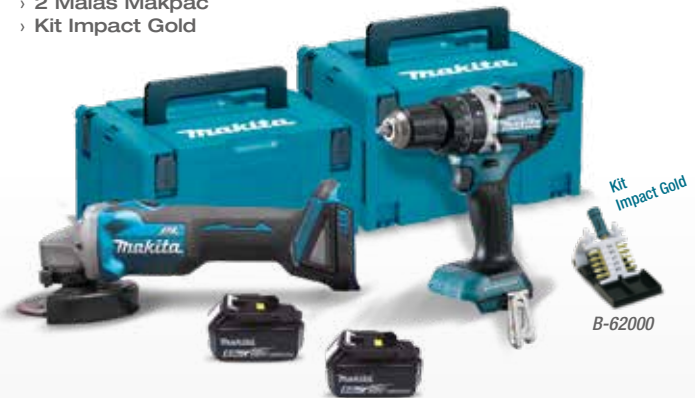
Kit Impact Gold + B-62000