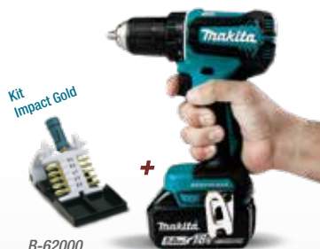
Kit Impact Gold + B-62000