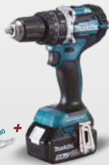
Guia de aparafusação + B-52934