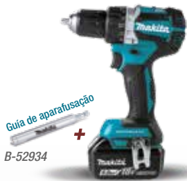
Guia de aparafusação + B-52934