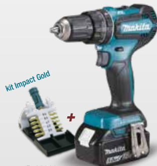
Kit Impact Gold + B-62000